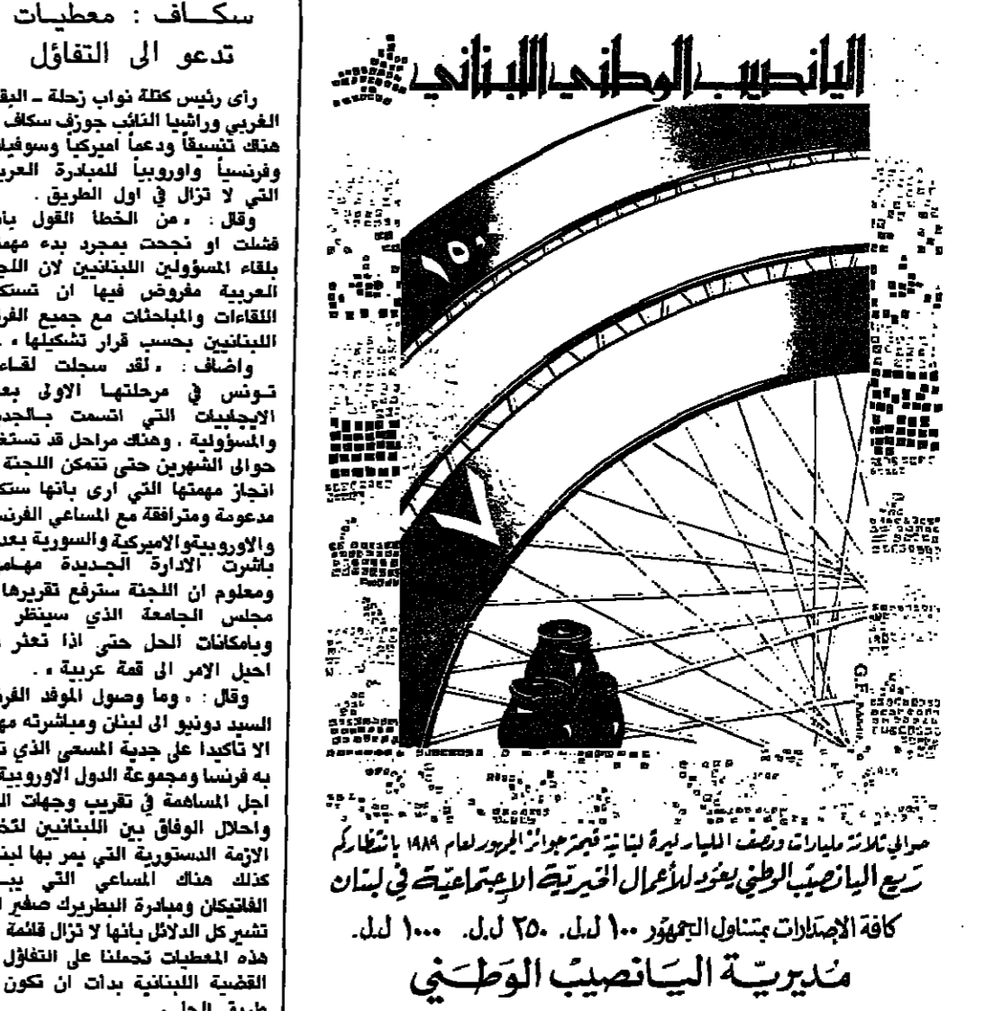
مديرية الانتخاب الوطني